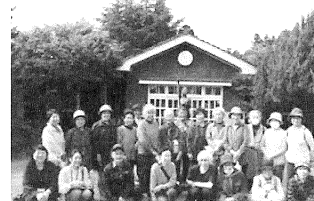
ひとり暮らし高齢者交流事業