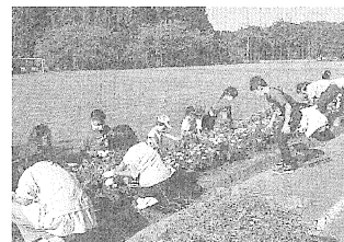
小学校の花壇活動